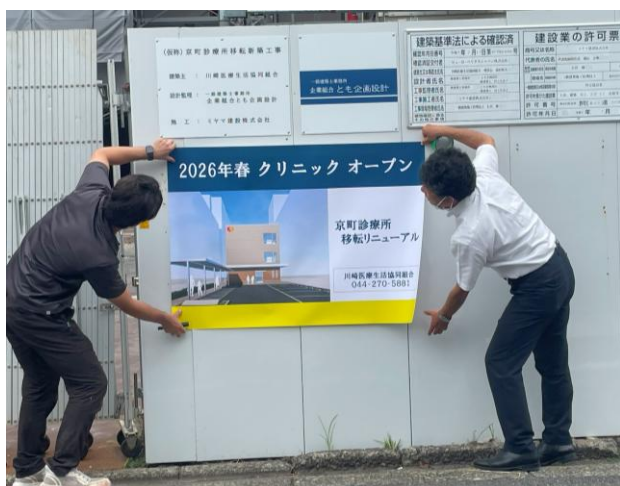
外看板の位置決めをする風景